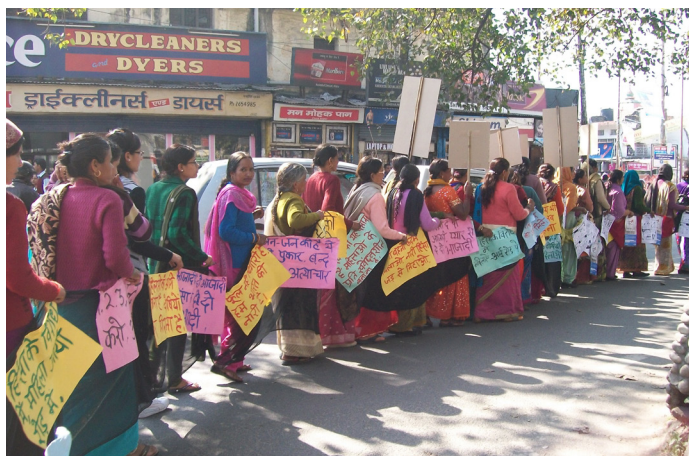
Protest bij gemeentehuis

voeren. Hierbij wordt niet alleen de bevolking benaderd maar wordt ook nauw samen gewerkt met de politie en de gemeentebesturen. Verschillende krachten, waaronder Astitva, bundelen zich in een internationale campagne genaamd 'One Billion Rising to Stop Violence Against Women'. Door deze voorlichting te geven en de campagne te steunen hopen we de situatie voor vrouwen in India te verbeteren.