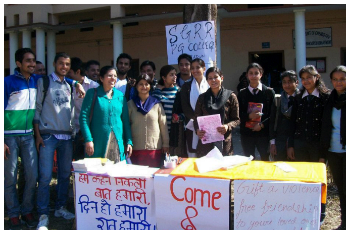
Voorlichting op school meentehuis